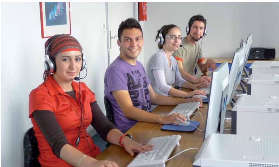
Innovatives Lernen am Computer im Selbstlernzentrum

Integrale Bestandteile der Bildungsregion Lippe sind auch die drei Selbstlernzentren (SLZ) in Detmold, Lemgo und Bad Salzuflen ( www.lippe-selbstlernzentren.de ). Die dezentralen Einrichtungen wurden im Rahmen des Förderprogrammes vom Bundesministerium für Bildung und Forschung „Lernende Regionen – Förderung von Netzwerken“ seit Mitte 2007 aufgebaut. Sie stehen seitdem nachhaltig Interessierten aller Altersgruppen offen, die selbstbestimmt nach eigenem Rhythmus lernen möchten. Professionelle Lernprogramme unterstützen in Verbindung mit einer qualifizierten Lernberatung und -begleitung von Pädagoginnen und Pädagogen das selbstgesteuerte Lernen. Seit einigen Jahren bieten die Selbstlernzentren auch gut nachgefragte Angebote des innovativen Lernens am Computer an. Diese finden entweder im Rahmen des Offenen Ganztags oder auch im Regelunterricht der lippischen Schulen statt.